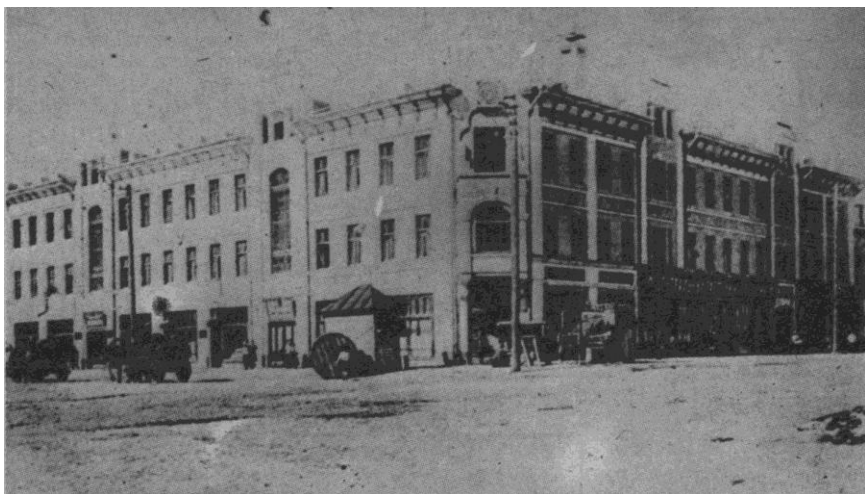
Здание на углу Киевской (пр. Ленина) и Менделеевской улиц, в котором размещалась редакция газеты «Коммунар».