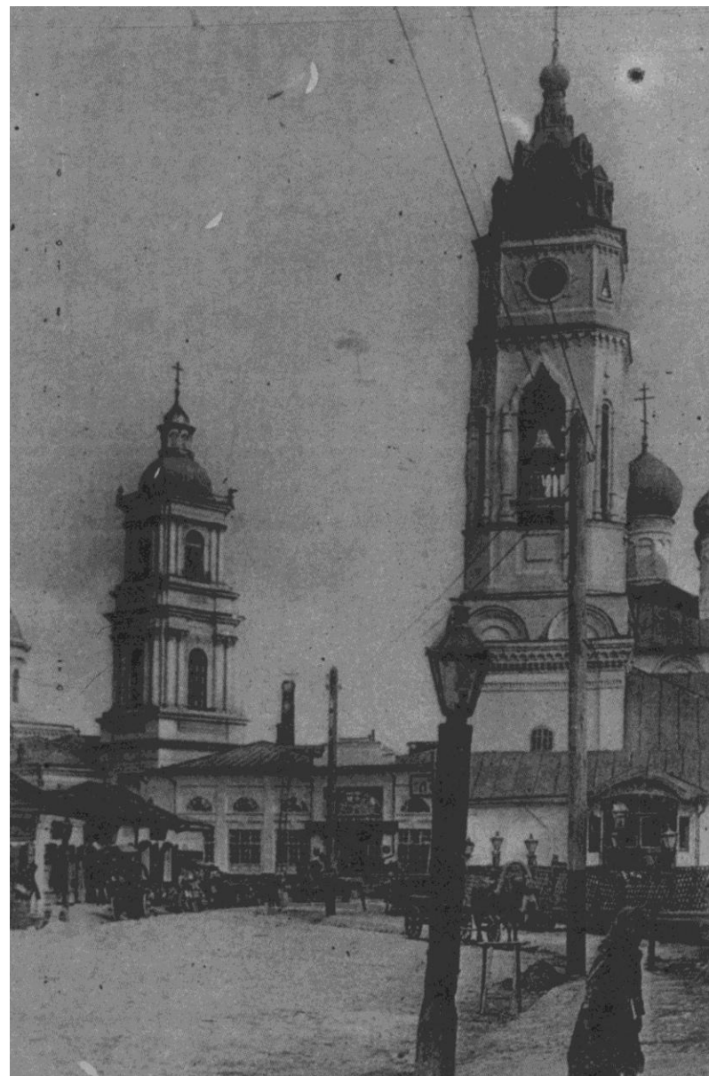
От Посольской (ныне Советская ул.) и до Кремля шла в Туле торговля. По выходным и праздникам работала у старых торговых рядов Жигалинская толкучка, на которой бывал Есенин.